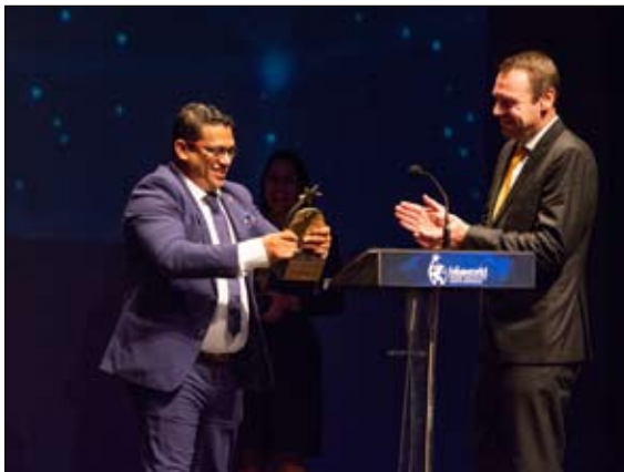
Google Home Training zrealizowane przez agencję Laqshya Live Experiences wygrało tegoroczną edycję konkursu.

Nagrody World Best Events to branżowe oskary. Mogą się o nie ubiegać firmy z branży eventowej i komunikacyjnej z całego świata. Do konkursu mogą być zgłaszane zarówno komercyjne jak i niekomercyjne eventy. Głównym kryterium oceny jest kreatywność i innowacyjność. W tym roku do konkursu zgłosiły się aż 303 eventy (o 2,4 proc. więcej niż w roku poprzednim).